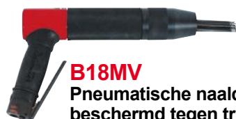
B18MV Pneumatische naaldbikhamer, beschermd tegen trillingen