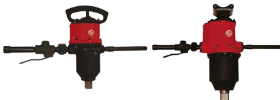
CP6130-T70 CP6240-T120 Pneumatische 1,5" Pneumatische 2,5" slagmoersleutel slagmoersleutel