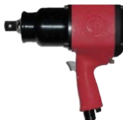
CP0611P-RS Pneumatische 1" slagmoersleutel