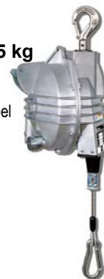
CP9968 Veerbalanceerder voor CP6240 belasting 55- 65 kg