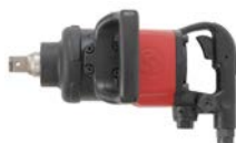
CP6920-D24 Pneumatische 1" slagmoersleutel