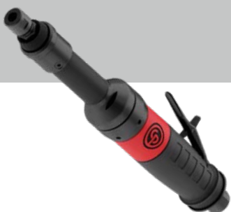
CP3550-180ES Rechte stiftslijper

Meer informatie over onze producten en oplossingen voor metaalbewerking vindt u op: tools.cp.com