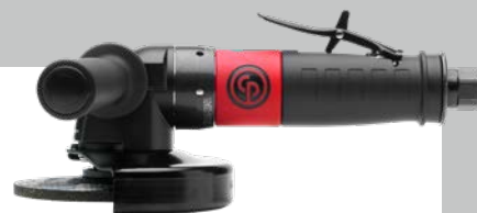
CP3550-120AA5 Pneumatische haakse slijpmachine