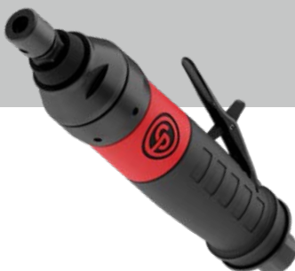
CP3550-120 Rechte stiftslijper