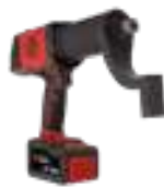
CP8613 tot 1300 Nm