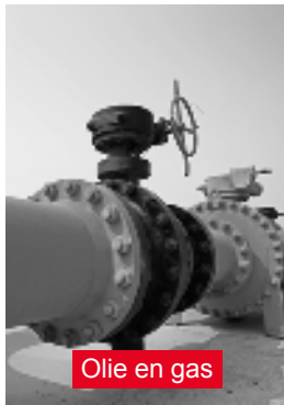
Olie en gas