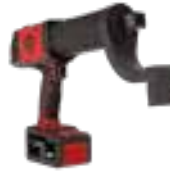
CP8626 tot 2600 Nm