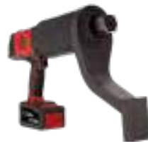
CP8681 tot 8100 Nm