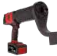
CP8641 tot 4100 Nm