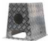
AB COFANO IN ALLUMINIO MANDORLATO ALUMINUM BOX