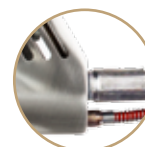
RACCORDI 90° 90° FITTINGS