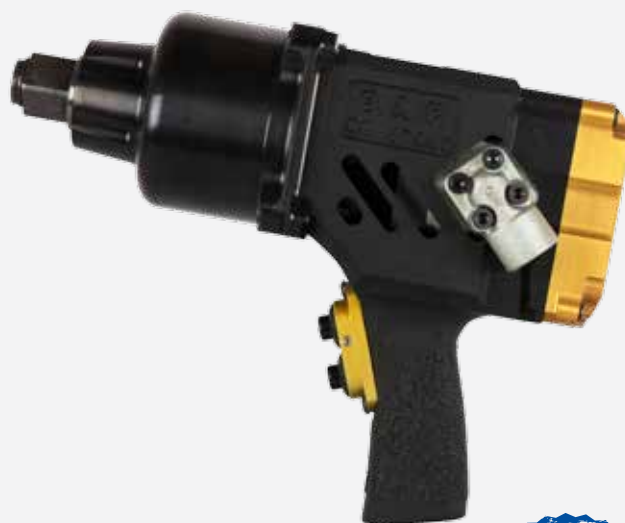
IMPACT WRENCH K560

Powerful and fast. Accurate and efficient. To offer you a reliable, durable and flexible bolting solution for maintenance and industrial production.