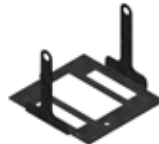
SS SISTEMA DI SOSPENSIONE SUSPENSION SYSTEM