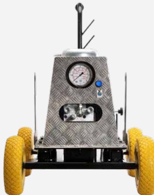
CONFIGURATION STP POWER UNIT

Product configuration is more than just a possibility. We would define it almost as a "strategy" designed to meet the needs of each of our individual customers.